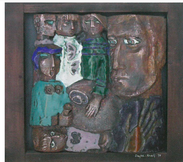
“Kaukaz I”, 1979, bakar, emajl

Ritam možemo osjetiti i taktilno. Na sljedećem primjeru pokušajte zatvorenih očiju prenijeti ritam koji osjećate prelazeći rukama po skulpturi.