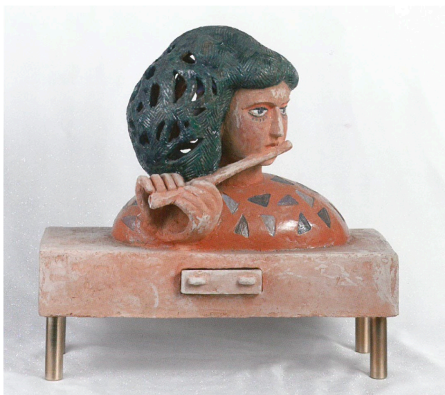
“Čarobna frula I”, 1992., terakota

Kakva je ova skulptura, možemo li ovdje govoriti o ritmu?