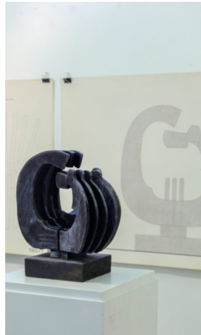
"Spomenik palim žrtvama fašizma u Leprovici", natječajna verzija, maketa i crtež, 1965.

Kako se ostvaruje ritmičnost na dvodimenzionalnoj plohi i u trodimenzionalnoj formi.