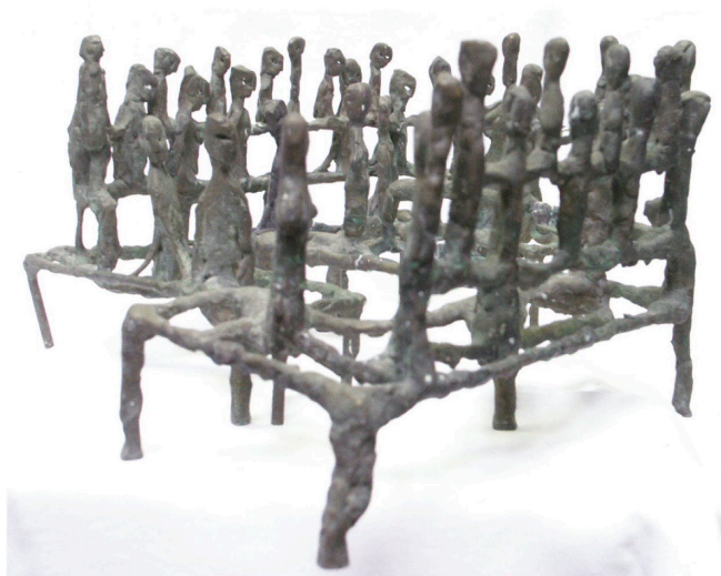
“Skupina”, 1970-ih, bronca

Jasnije nego ijedna druga kiparska cjelina dotad, “Skupine” (ili “Nizovi”) otkrile su joj značenje ritma, stvorenog već iz potrebe gradnje uzajamnih odnosa pojedinaca u mnoštvu. Prirodno je bilo da nakon “Skupina”, nastane i ciklus “Ritmovi”, stvoren gotovo istodobno, a prvi put izložen 1972. godine u Opatiji.